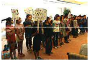
辻堂小学校 生徒による劇