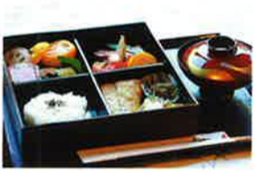
お正月のお節料理