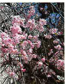
枝垂れ桜 藤沢市民会館中庭

1日◎★吉屋信子記念館公開(長谷/江ノ電「長谷」) 6日まで。午前10時〜午後4時。