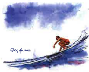
かとうさんの作品