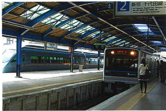
日本・小田急・片瀬江ノ島駅