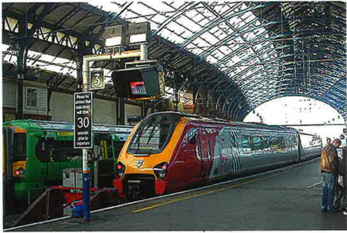
イギリス・ブライトン駅