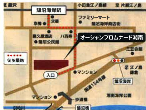
小田急線「鶴沼海岸」から徒歩6分

ホームの日々の生活をブログで紹介中 http://www.ocean-promenade.com