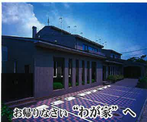
お帰りなさい「わが家」へ