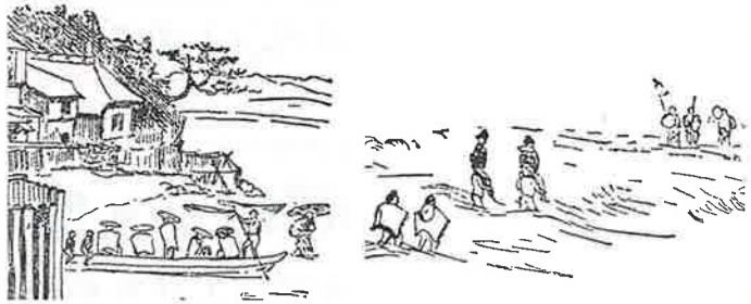
江の島へ渡る人々 (明治 10 年) モースのスケッチより