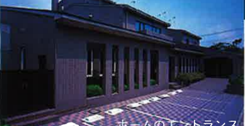
ホームのエントランス

小田急線「鵜沼海岸」から徒歩6分 ※45㎡~68㎡のマンションタイプ。 ※もし介護が必要になられたときは、住み慣れた居室での介護サービス。 ※館内プール完備。