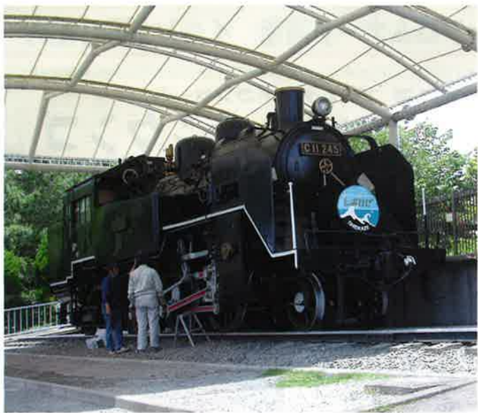
鵠沼運動公園の保存蒸気機関車 C11-245 機 H24. 6. 10.