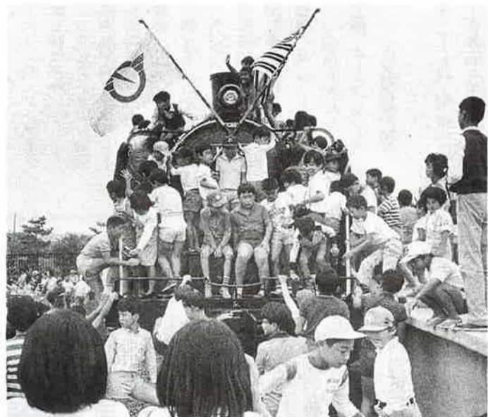
SLひろばオープン当日の賑わい S51. 10. 1.

★SLまつり 日時 10月14日① 正午～午後6時 会場 鵠沼運動公園 SLひろば