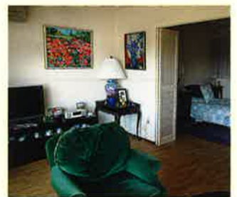
実際にお住まいの入居者の居室